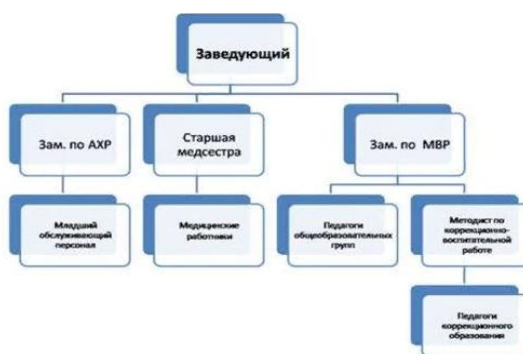
Рисунок 2 – Структура предприятия